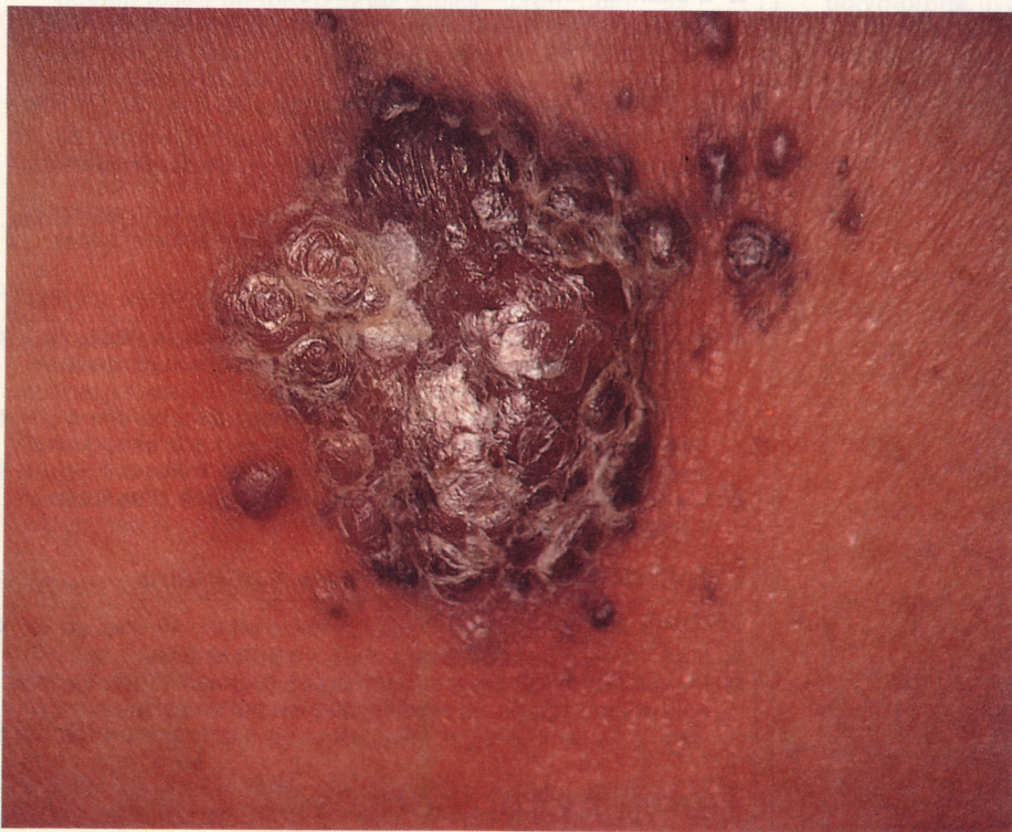
Epithélioma basocellulaire pigmenté