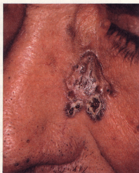
Mélanome avec métastases locales