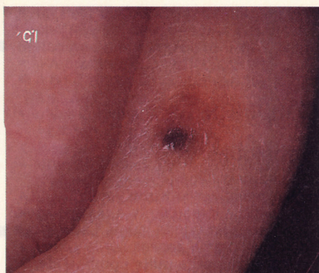
Mélanome malin (SSM)